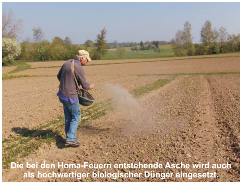
Die bei den Homa-Feuern entstehende Asche wird auch als hochwertiger biologischer Dünger eingesetzt.