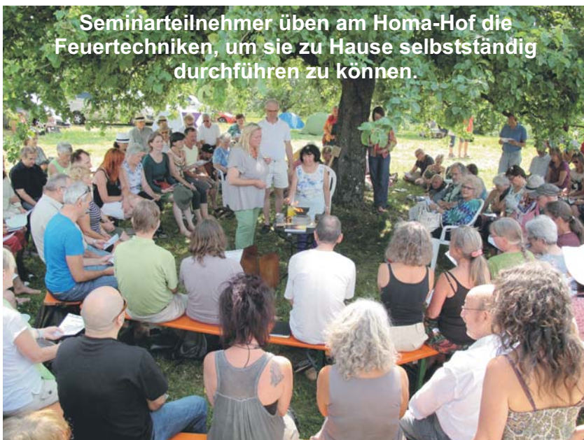
Seminarteilnehmer üben am Homa-Hof die Feuertechniken, um sie zu Hause selbstständig durchführen zu können.

2018 jährt sich nun der 100. Geburtstag von Param Sadguru Shree Gajanan Maharaj. Am 17.5. wird dieser Tag feierlich am Homa-Hof begangen mit gemeinsamen Homa-Feuern rund um die Grenzen des Hofes und einem gemeinsamem Abend-Agnihotra (Einladung und Näheres auf agnihotra-online.com ). Zu diesem besonderen Jubiläum ist auch die Herausgabe von Horst Heigls Büchern „Erfüllte Verheißungen“ (Band I, II) geplant, die seine Begegnungen mit Shree und dessen umwälzende Aussagen beschreiben, eingebettet in die Schilderung von Horsts Lebensgeschichte.