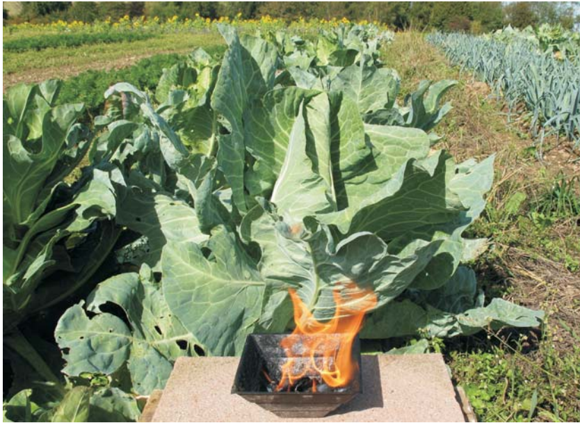
Oben und Mitte: Pflanzen gedeihen in der Homa-Atmosphäre prächtig und werden oft überdurchschnittlich groß.